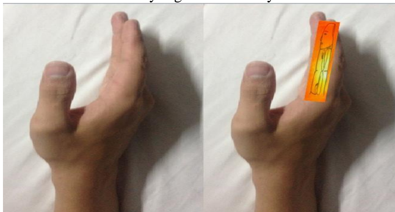
Figura 4. Mano derecha, posición lateral

Figura 3. En esta vista de la región dorsal de la mano, se observa cómo se refleja nuestro cuerpo en cada dedo, el pulgar no está representado en esta lámina pero igualmente es parte de este holograma. Como verá la zona de la uña se corresponde con la parte posterior de la cabeza, y hasta la articulación interfalángica distal se localiza la columna cervical, en la falange media se localiza la columna dorsal o torácica y en la falange proximal tenemos la columna lumbar y seguido el sacro y el coccis