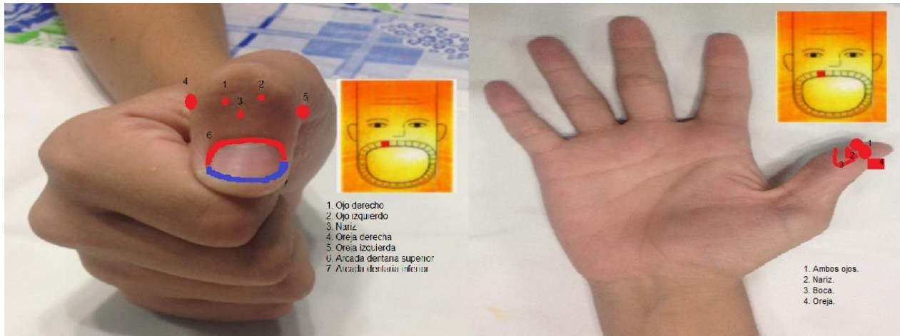
Figura 5. Cara neonatal

Figura 5. Aquí tenemos la representación holográfica de la cara neonatal, que expresa carácter dual y comentamos ese carácter dual, es que vista en la falange distal del dedo pulgar tiene la representación que usted puede observar en la primera ilustración, en el dorso de la falange distal del pulgar y la que le sigue está representada en la misma falange distal del dedo pulgar, pero en la representación del holograma básico que pudimos observar en el trabajo anterior, la cara está representada en la zona volar de la falange distal del propio pulgar, ese es su carácter dual, tiene representación tanto volar como dorsal.