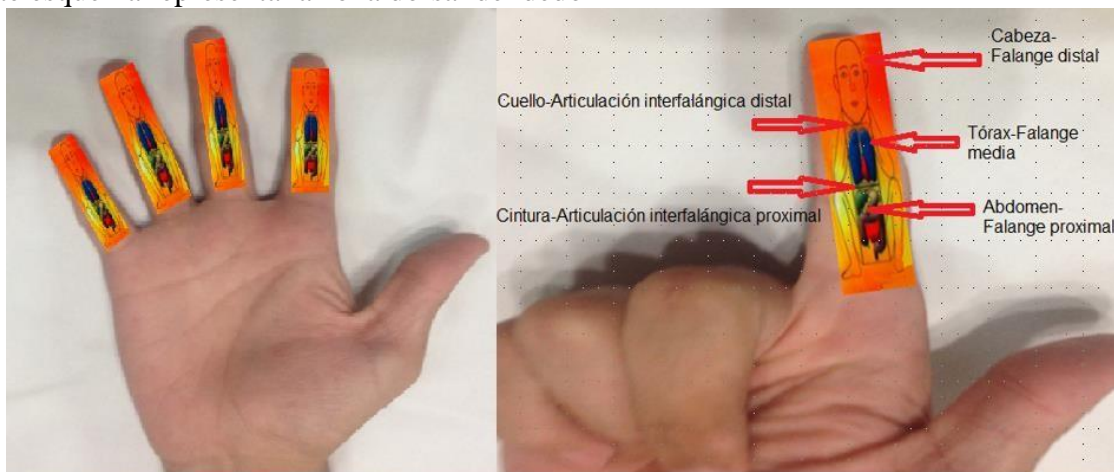
Figura 2. Región palmar de la mano

Figura 2. En esta vista de la región palmar de la mano, se observa cómo se refleja nuestro cuerpo en cada dedo, el pulgar no está representado en esta lámina pero igualmente es parte de este holograma. Aquí le representamos un solo dedo en su posición ventral con el esquema superpuesto para que pueda observar